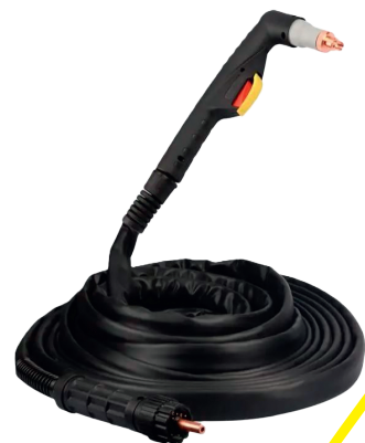
Расходные элементы горелки